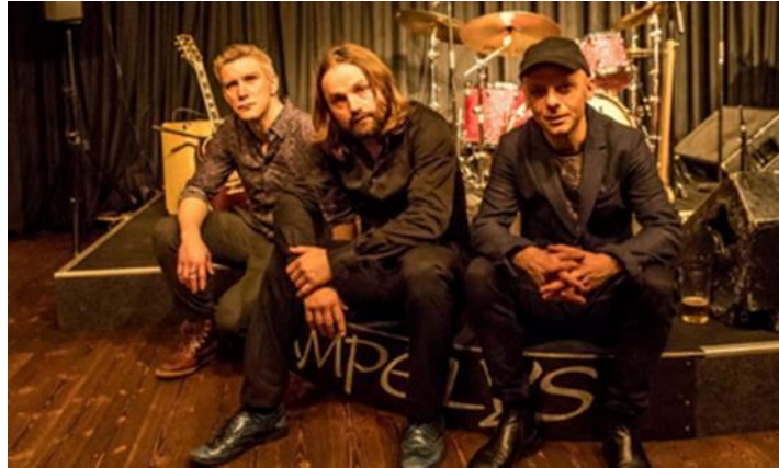
Fried Okra

Fried Okra spiller deres egne sange. Musikken har klare forbindelser til bluesen - John Lee Hookers hypnotiske boogie og Junior Kimbroughs og R. L. Burnsidés rå og uortodokse Hill Country blues.